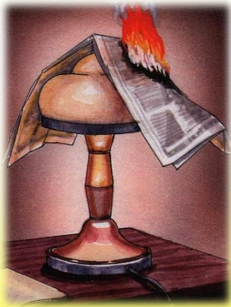
Затемнение электроламп сгораемыми материалами (бумагой, тканью)