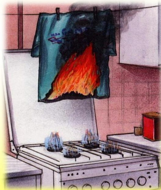
Сушка белья над газовыми плитами